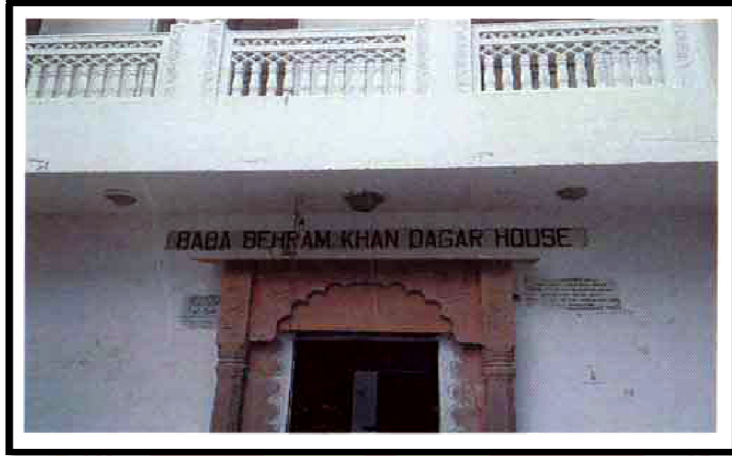
जयपुर: बाबा बहराम खां डागर हाउस

आपने अपनी लगन और निष्ठा से निरन्तर साधना कर अपने व्यक्तित्व को इस तरह विकसित किया कि आप एक समर्थ और समर्पित गुरु कुषल वाग्ग्येकार, सफल संगीत-समायोजक एवं सिद्ध कलाकार के रूप में प्रतिष्ठित हो।